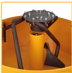
Blandearme, komplet, m/gummiskovle Varenr. 200 024