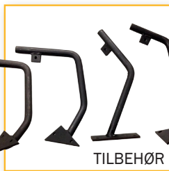
Blandearme u/topskive, u/gummiskovle Varenr. 200 024B