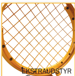
Dust Controller (Støvliminator) Varenr. 200 001DL DB-nr. 1746711