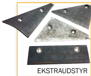
Løse blandeskovle, Hardox-stål Varenr. 200 024S