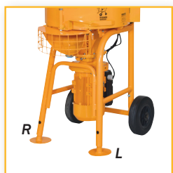
Teleskopben Varenr. 40 017R / DB-nr. 5197213 Varenr. 40 017L / DB-nr. 5197214