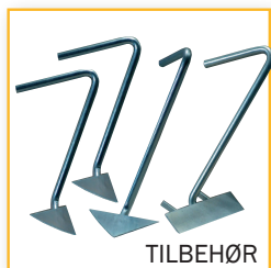
Blandearme u/kryds, m/stålskovle Varenr. 40 022A DB-nr. 5197219