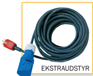
EKSTRAUDSTYR CE kabel, 10 M, DK stik Varenr. 1160 DB-nr. 5223314