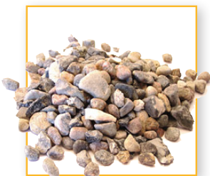
8-16 mm sten