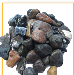
16-32 mm sten