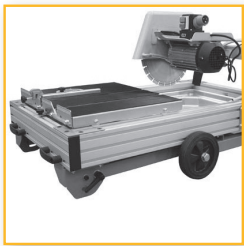
Foldbare ben for SDS350-45